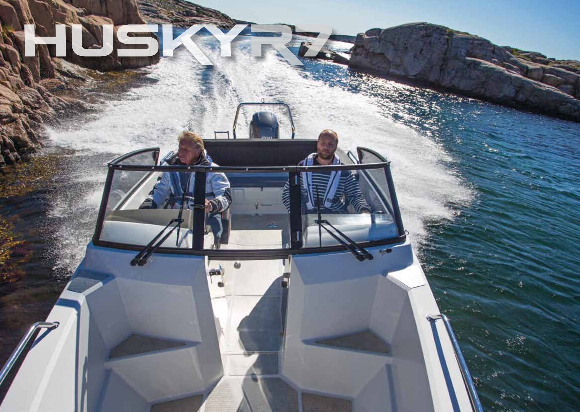
FINNMASTER HUSKY R7